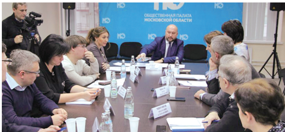
У Общественной палаты Московской области главный вопрос: «Как помочь фрязинской библиотеке?»