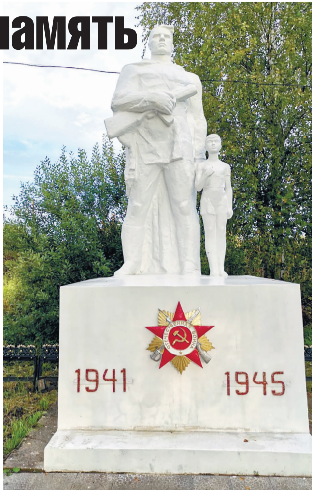
Реставрация памятника обошлась в полтора миллиона рублей.

Ремонт затянулся до глубокой осени, а зимой пришлось сделать навес для тепла и продолжать работы, чтобы успеть к юбилею Победы. Ранней весной сделали красивый заборчик, на дорожках уложили тротуарную плитку. 9 Мая открыть не смогли – пандемия. Всё было почти готово, только не успели доски установить.